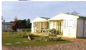
N° 3 & 4 LE GRAND TRIANON