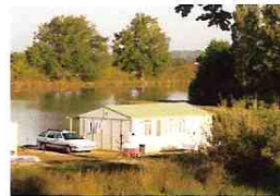
N° 1 « CLASS 3 ARRIERE