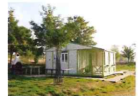
N° 5 « COTTAGE HANDICAP