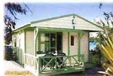
N° 2 "CLUB 5"